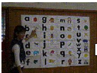
地域の英語活動の実践開始