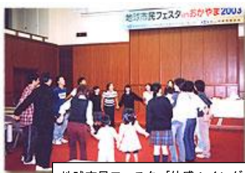
地球市民フェスタ「体感！イングリッシュサイズ」

主催 地球市民フェスタ in おかやま 2004 実行委員会(岡山県/(財)岡山県国際交流協会/独立行政法人 国際協力機構 JICA 中国/岡山県国際交流団体連絡協議会