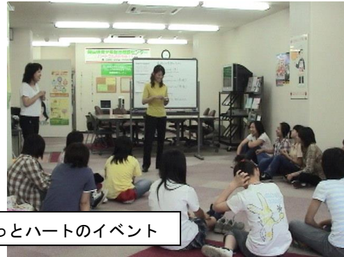
岡山県青少年課 ほっとハートのイベント